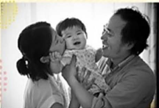
お腹の赤ちゃんと一緒に 手術をのりこえママになりました!