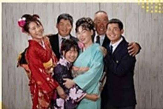
5回目の再発でこれから手術です。小児がんを 乗り越えた家族と力を合わせて乗り越えていきます!